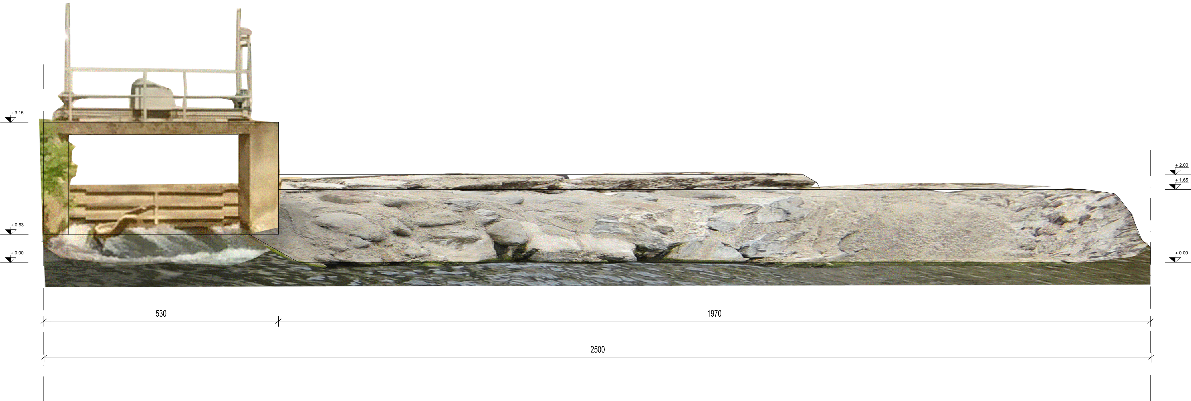
RILIEVO GEOMETRICO E ORTOFOTO fronte